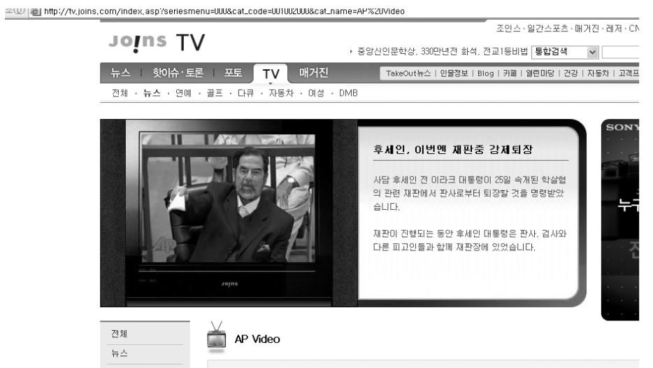
AP텔레비전의 영상을 서비스 중인 조인스닷컴.

사태의 심각성을 인식한 당시 경영진은 실무진에 계약을 반드시 저지하라고 지시했으나 결국 실패로 끝나고 AP, 중앙일보 측과 관계만 소원해지는 결과를 낳았다.